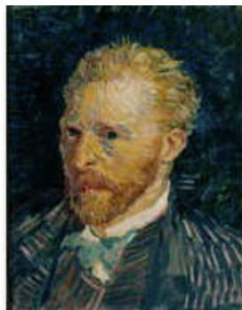
Vincent Van Gogh 《Portrait of the artist》1887