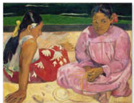
Paul Gauguin 《Tahitian women》 1891