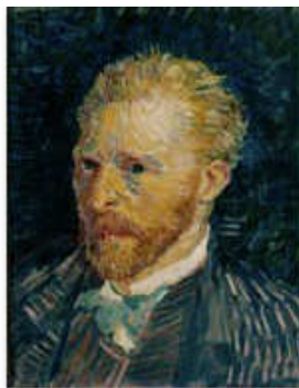
Vincent Van Gogh 《Portrait of the artist》 1887